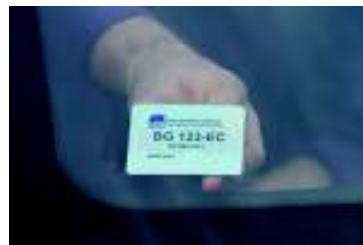
6 ПРЕЂИ ПРСТОМ ПРЕКО ЗАЛЕПЉЕНЕ НАЛЕПНИЦЕ