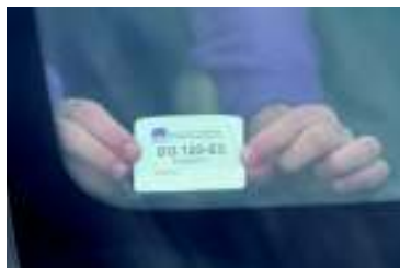
5 ПОЗИЦИОНИРАЊЕ НА ДОЊИ ДЕСНИ ДЕО ВЕТРОБРАНскоГ СТАКЛА