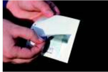
2 СКИДАЊЕ НАЛЕПНИЦЕ СА НОСАЧА НАЛЕПНИЦЕ