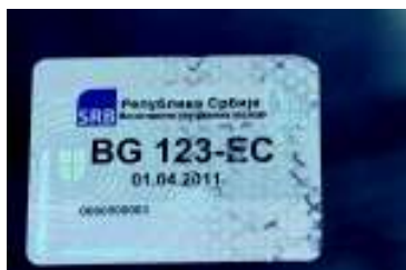
НЕИСПРАВНО! ПОКУШАЈ СКИДАЊА И ПОНОВНОГ ЛЕПЉЕЊА НАЛЕПНИЦЕ