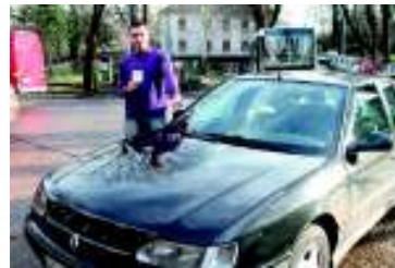
4 ПОЗИЦИОНИРАЊЕ НА ДОЊИ ДЕСНИ ДЕО ВЕТРОБРАНскоГ СТАКЛА