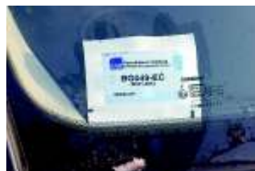
НЕИСПРАВНО! НАЛЕПНИЦА НИЈЕ СКИНУТА СА ПАПИРНОГ НОСАЧА