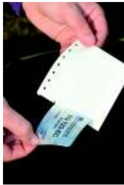
3 СКИДАЊЕ НАЛЕПНИЦЕ СА НОСАЧА НАЛЕПНИЦЕ